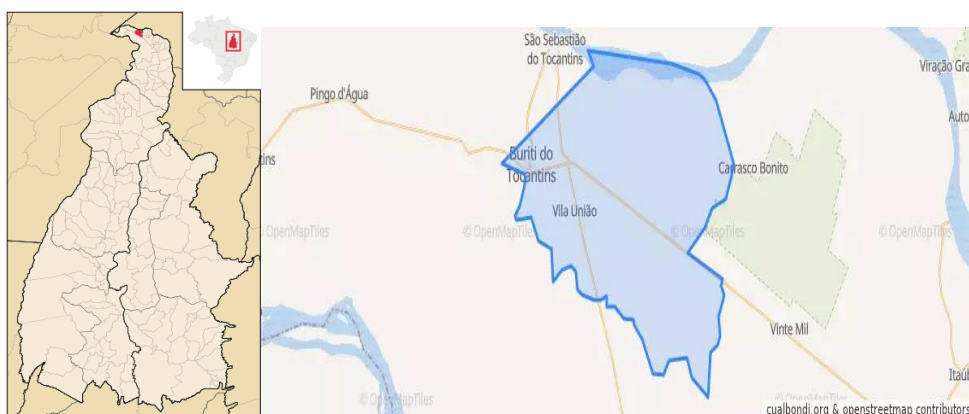
Figura 1- Localização e Mapa do Município de Buriti do Tocantins.